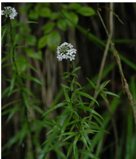
Fig. 2. A photograph of Hong-do-kka-chi-su-yeom ( Lysimachia pentapetala Bunge)

본 종은 높은 산의 바위 또는 고목 밑동에 착생하는 상록 다년초로서, 일본, 중국, 러시아 등지에 분포하며, 국내에서는 설악산, 태백산 등의 중·북부지역에 분포한다. 근연종인 미역고사리와는 인편의 색과 포자낭군이 가장자리에 치