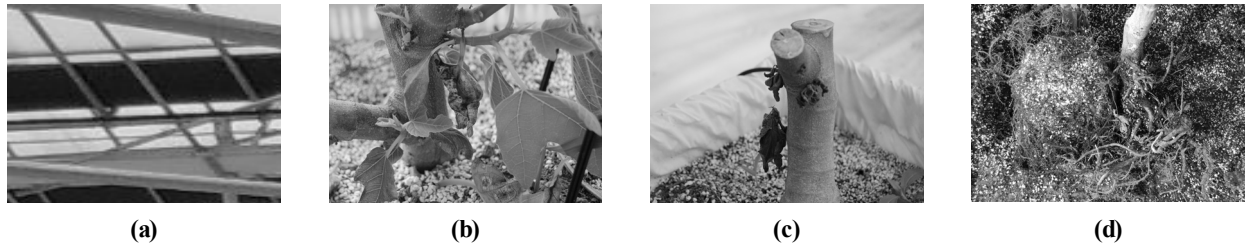
Fig. 1. NO 2 (g) toxicity symptom of fig plant by applying nitrite onto low pH artificial soil. (a) scenery, (b) leaf burning (c) leaf withering (d) root browning.