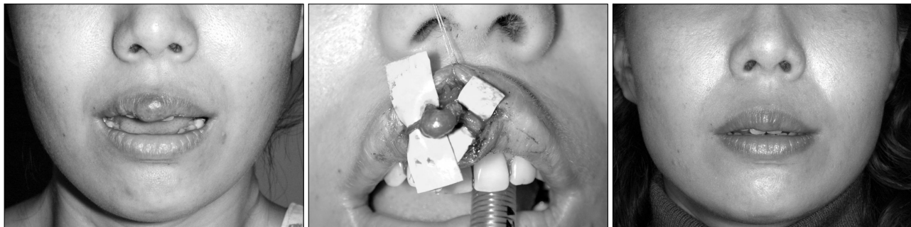
Fig. 3. Arteriovenous malformation on upper lip in a 36-year-old female. (Left) Preoperative photograph, (Center) Intraoperative photograph, (Right) 3 months after surgery.