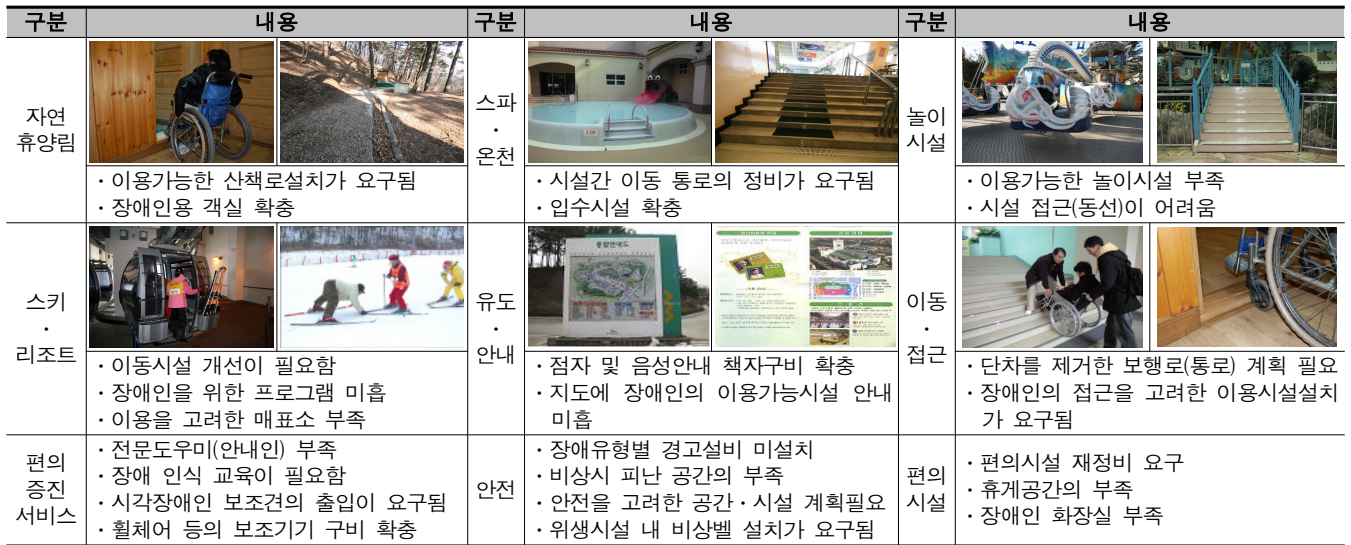
[표 9] 실태분석에 따른 문제점 분석