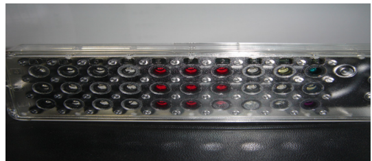
[그림 2] BBL™ crystal id kit

증식한 균의 단일 집락을 취하여 그림 2에서 보는 바와 같이 crystal id kit(BBL, USA)의 용법에 따라 접종하고, 19시간 동안 배양하여 판정하고, 컴퓨터 프로그램(BBL, USA)을 이용하여 균 명을 확인하였다. 세균 명이 확인된 균에 한하여 MIC 검사를 실시하였으며, 검사를 위한 증균은 Bacillus subtilis 의 배양법에 따라 진행하였다.