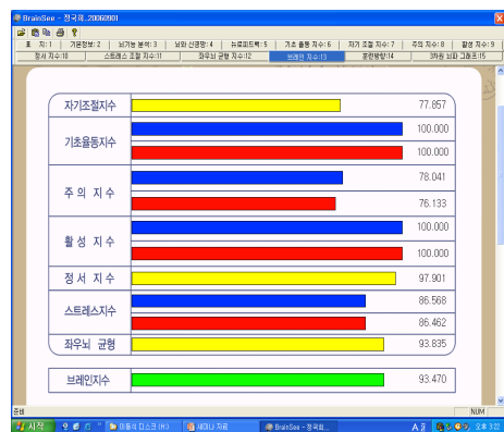
[그림 1] 본 연구에 사용된 뇌기능분석 프로그램