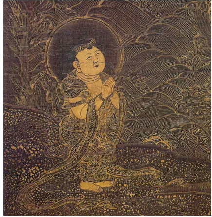
<그림 5> 서복사 소장 수월관음도의 선재동자 세부표현.