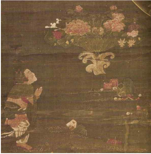
<그림 3-1> 일본 센소지 소장 수월관음도에 표현된 선재동자 세부표현. 출처: 『고려불화대전』도37 인용.