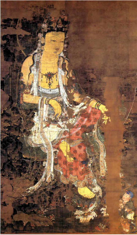
<그림 1> 수월관음도. 고려후기. 일본 가가미신사 소장.