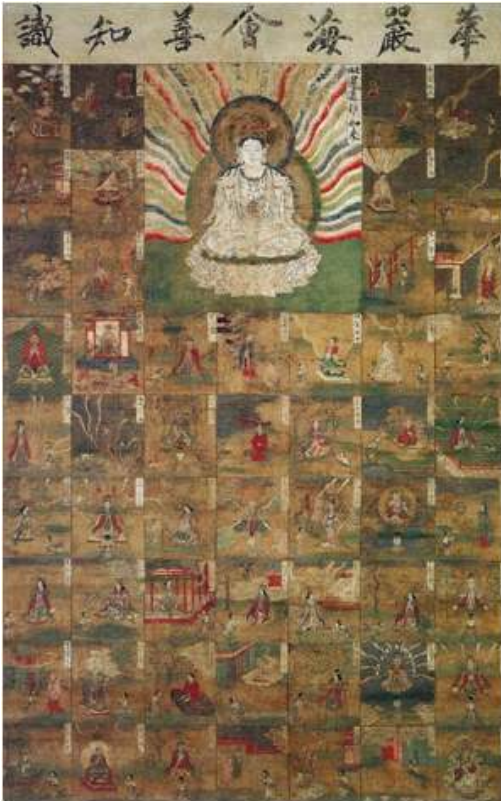
<그림 6> 華嚴海會善知識曼多羅. 비단에 색. 세로 182.4cm. 가로116.1cm. 가마쿠라시대(13세기). 도다이지 소장.