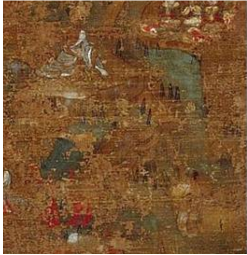
<그림 4-1> 도다이 지 소장 華嚴五十五小繪의 10면 중에서 勝熱바라문을 찾아간 선재동자의 세부표현.

바로 만족왕과 바수밀다라는 여성이다. 만족왕은 완벽주의자인데다가 많은 정치가와 병사를 거느리고 풍족한 치세를 했지만, 잘못을 저지른 사람에게서는 잔혹하리만치 엄한 형벌(예를 들면, 손과 발을 자른다던지, 귀를 도려낸다든지 하는 비인간적인 처벌을 내림)을 내렸고, 바수밀다는 매우 아름다운 미모를 가진 여성으로서 선재동자에게 자신의 유혹을 받아들이면 도를 얻을 수 있을 것이라고 말한다. 결국, 승열바라문의 잘못된 가르침, 만족왕의 광폭함, 바수밀다의 애욕을 통해 선재동자는 다시금 자신을 자각하고, 올바른 보살행을 구하고자 여정을 떠나게 된다.