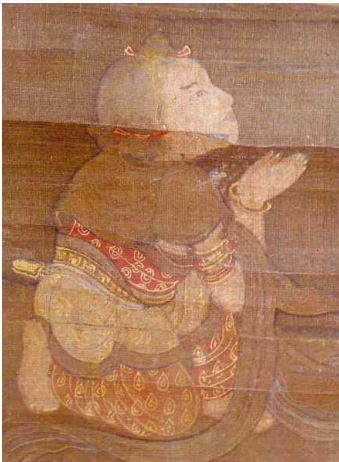
<그림 6> 서구방 필 수월관음도의 선재동자 세부표현. 고려시대. 1323년. 일본 센오쿠하쿠코칸 소장.

표현되고 있는데, 이는 선재동자의 산스크리트어가 Sudana로 ‘풍족한 베품’이란 뜻이며, 또 선재동자의 출생 시에 갖가지 귀한 보배가 저절로 솟아났다고 하는 선재동자와 관련된 이야기에 적합한 묘사라고 볼 수 있다. 두 발을 가지런히 모으고, 무릎을 약간 굽히고 서 있거나, 혹은 한쪽 무릎을 세우고 꿇어앉아 가슴 앞에서 양손을 다소곳이 모아 합장하면서 화면 상단의 관음보살을 바라보는 모습에서 구법을 찾고자 원하는 선재동자의 간절함이 절로 느껴진다.