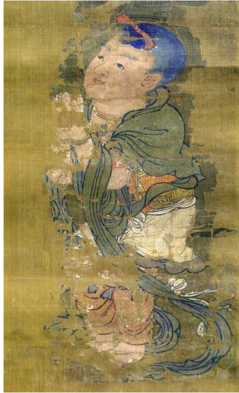
<그림 1-1> 일본 가가미신사 소장 수월관음도에 표현된 선재동자 세부표현.