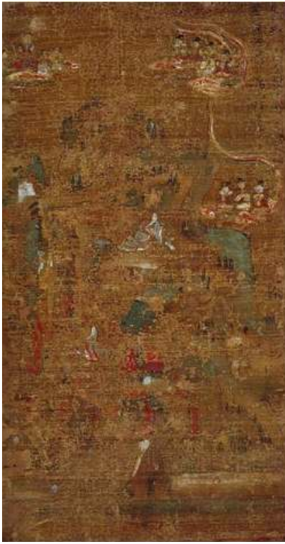
<그림 4> 華嚴五十五小繪.10면 중에서 勝熱바라문을 찾아간 선재동자. 비단에 색. 75.8x48.5cm. 헤이안시대(10세기). 도다이 지 소장.