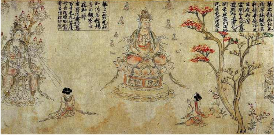
<그림 5> 『華嚴五十五所繪卷』중에서 普救衆生妙德主夜神(바라보아 왼쪽)과 喜目觀察衆生主夜神(바라보아 오른쪽)을 찾아가는 선재동자. 도다이지 소장.

천인이 2인, 野天이 8인, 동자가 3인, 동자의 스승이 1인, 海師가 1인, 장자가 10인, 의사가 1인, 여성이 10인, 외도가 1인, 왕이 2인이다.