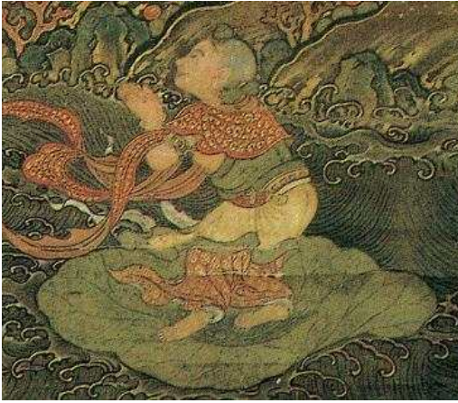
<그림 4> 일본 다이토쿠지 소장 수월관음도의 선재동자 세부표현.