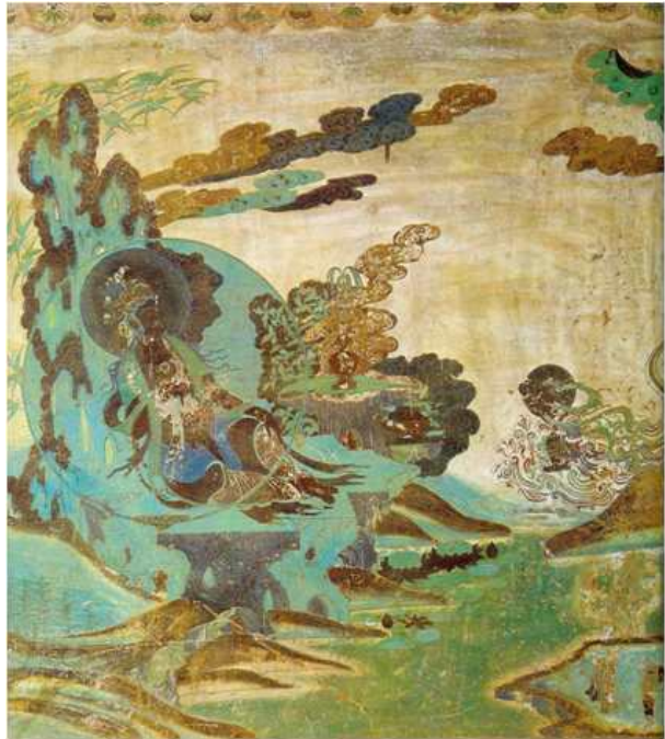
<그림 8> 수월관음도. 서하. 러시아 에르미타주박물관 소장.

앞아 있는 관음보살의 모습과, 멀리서 찾아온 선재동자의 모습을 볼 수 있다. 지금까지 보아온 구도, 즉 바라보아 우측에 관음보살이 배치하고, 왼쪽 하단부에 선재동자가 표현되는 구도와는 정반대로 되어 있고, 채색에서 느껴지는 푸른 백의 색채감 등은 한국과 일본과는 다른 모습을 보여주지만, 전체적인 면에서는 유사한 모습임을 알 수 있다.