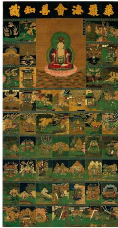
<그림 7> 華嚴海會善知識曼多羅. 비단에 색. 세로134.9cm. 가로80.6cm. 중국 명대(15세기). 일본 도다이지 소장.

중국에서 제작된 것이 판명된 작품이라고 한다. 이 두 작품은 상단에는 중앙에 노사나불과 그 좌우로 6개의 장면이, 그리고 하단에는 42개의 장면이 배치되어 있다. 한편 도다이지 개산당에서는 지금도 매년 4월 24일에 선지식공양 법회가 열린다고 한다. 개산당에 이 작품을 걸고, 법회의 서두에 55선지식을 권청하고, 끝부분에 55선지식의 이름을 부르면서 예배한다고 한다.