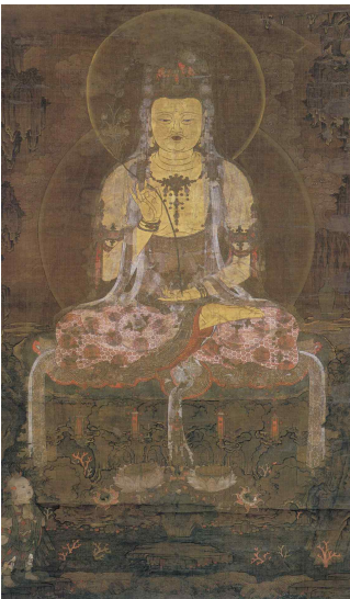
<그림 2> 수월관음도. 일본 고잔지 소장.

하고 시선은 선재동자를 향하지 않고 정면을 응시하는 모습을 취하거나, 혹은 센소지 소장의 작품처럼 비스듬히 서서 선재동자<그림 3, 3-1> 3) 를 바라보는 형식도 보인다.