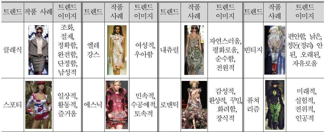
<표 2> 2000년 이후 주요 패션 트렌드와 트렌드 이미지