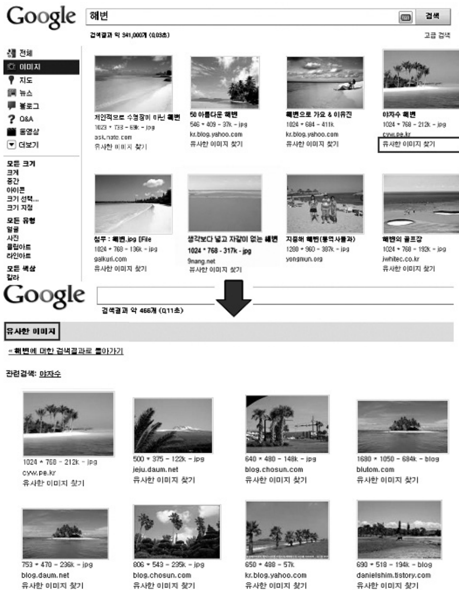
〈그림 1〉 구글의 유사한 이미지 찾기 기능

점은 한계로 지적될 수 있다. 즉 이용자가 질의로 예제 이미지나 동영상 자료를 직접 업로드하여 이와 유사한 자료를 찾게 하는 것이 향후 고려되어야 할 과제라고 할 수 있다.