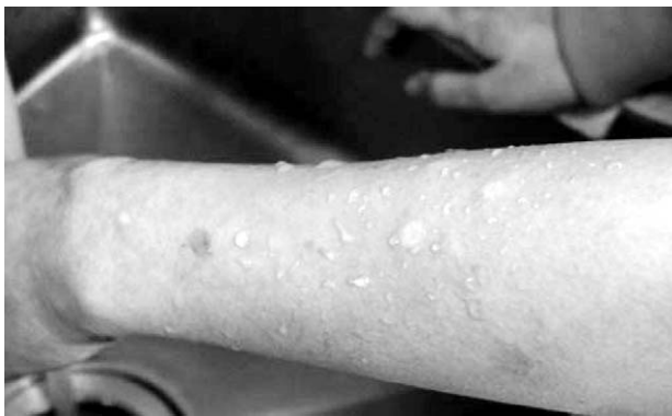
Fig. 1. The patient had a whitish maculae and patchy areas with accentuated rim on her left forearm.

화학 물질에 의한 손상정도는 각 물질의 특성과 농도 그리고 접촉 시간 등에 따라 결정된다. 산성 물질의 경우 조직에 응고괴사를 발생 시켜 수상 직후 동통이 매우 심하지만, 알칼리성 물질의 경우 액화괴사를 발생시켜 수상 초기에 나타나는 임상 양상은 산성 물질에 비해 심해 보이지만 알칼리는 조직에서 단백질, 지방과 결합하여 수산화 이온이 조직 깊이 침투할 수 있게 하기 때문이다 3) .