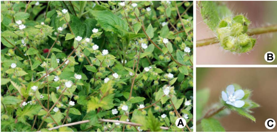
Fig. 1. Photograph of Thyrocarpus glochidiatus Maxim. A. Habit; B. Fruit; C. Flower.

엽은 주걱형으로 엽신이 좁아지면서 엽병처럼 되고, 길이는 4.5–6.0 cm, 너비는 5–8.5 mm 정도 이다. 경생엽은 일반적으로 장타원형이며 무병이다. 화서는 총상화서로 1–2 회 분지하기도 하며, 꽃은 액생 혹은 정생한다. 소화경은 개화기에 1 mm 이하로 매우 짧으며 열매 성숙기에 길이 4–8 mm 정도로 길어진다. 소화경 밑부분에 포엽이 달리며 열매성숙기에 길이 1.5–2 cm, 너비 4.5–7 mm 정도로 좁은 난형 혹은 장타원형이다. 꽃받침은 5개로 장타원상 난형이고 개화기에는 길이 2.5 mm, 너비 1 mm 정도이며, 열매성숙기에는 길이 5.5–6.5 mm, 너비 2.5–3.5 mm 정도로 커진다. 화관은 하늘색 혹은 하얀색이고 길이 3.8 mm 정도로 꽃받침에 비해 약간 더 길다, 관통(tube)은 화관의 2/3정도이고 중상부에 1 mm 정도의 부속체 5개가 있으며 그 밑에 수술이 위치한다. 판연(lobe)은 5 갈래로 반원형이며 벌어진다. 약은 타원형으로 길이 0.5 mm, 너비 0.3 mm 정도이다. 견과는 4개로 흑갈색이며 길이 2.5 mm, 너비 2 mm 정도이고, 견과 가장자리는 두 층으로 된 잔모양의 부속체가 있으며 외층 가장자리는 깊게 갈라져 갈고리모양처럼 되며 정단부는 부풀고, 내층 가장자리는 내부로 축소된다(Fig. 1, 2).