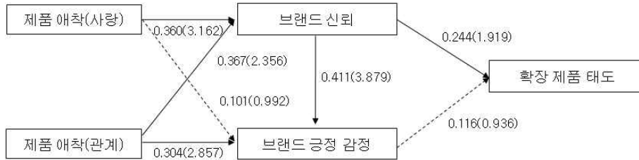
<그림 2> 구성개념들 간의 구조관계와 경로계수

를 구하고, 이 값들을 가지고 계산을 하여 구성개념신뢰도와 평균분산추출(AVE)을 측정하였다. <표 1>에서 보는 바와 같이 모든 요인에서 신뢰계수가 0.8이상을 나타내어 일반적 신뢰도 기준인 0.6을 초과하고 있다. 또 잠재개념에 대해 지표가 설명할 수 있는 분산의 크기를 나타내는 평균분산추출(AVE)에서 모든 요인에서 0.5보다 높게 나타나고 있다[30].