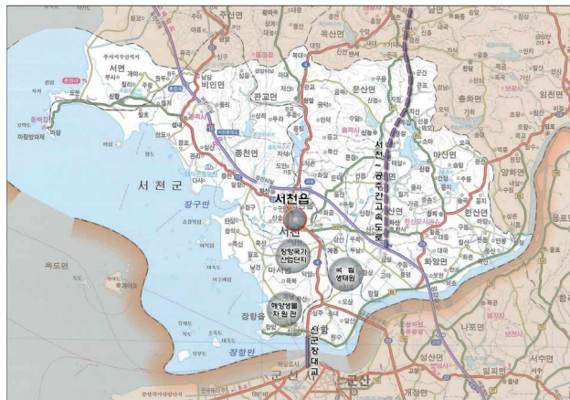
〈그림 4〉 서천읍 주변지역 개발사업 위치도