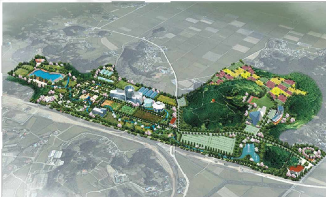
〈그림 5〉 국립생태원 계획(안)