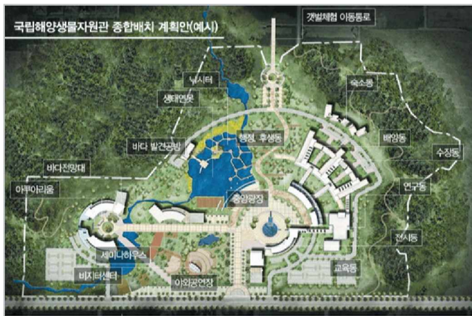
〈그림 6〉 국립해양생물자원관 계획(안)