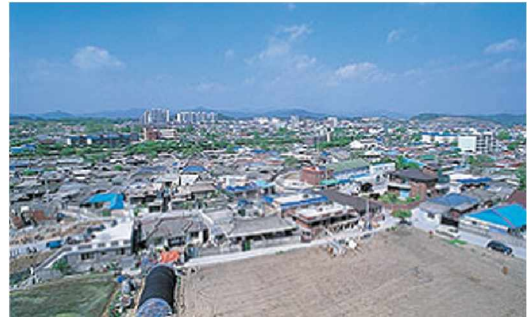
〈그림 2〉 서천읍 전경

인구특성상 서천읍내의 학생수는 인구비에 비하여 매우 높은 편인데, 이는 20~40대 거주비가 높기 때문이며, 고등학교 학생비율이 높은 것은 군내의 유일한 남녀공립 인문계 고등학교가 서천읍에 위치하고 있기 때문이다.