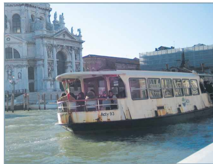
〈그림 6〉 곤돌라와 수중택시