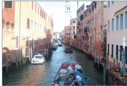
〈그림 7〉 광장 및 수로