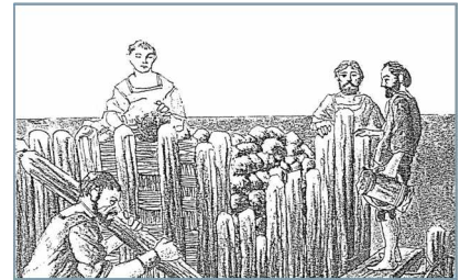
〈그림 5〉 인공지반을 만들기 위한 기초 작업