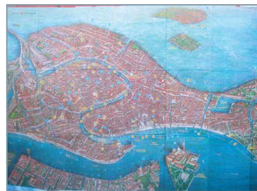
〈그림3〉 베니스 지도