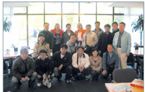
〈그림 1〉 연수자 단체사진

본 해외출장의 목적은 선진외국의 우수제도 및 정책추진현황을 파악하고, 지역개발 성공사례를 통해 지역개발의 종합적인 정책방향을 마련하고자 하는 것이다. 9박 11일의 일정으로 이탈리아, 스위스, 프랑스, 독일, 네덜란드 등 유럽 5개국을 다녀왔으며, 그 중 역사적·문화적 유산을 보전하여 관광산업 활성화에 성공한 이탈리아 베네치아 지역을 살펴보고자 한다.