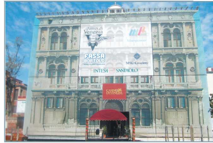
〈그림 8〉 사진촬영을 하여 건물 보수시 참조