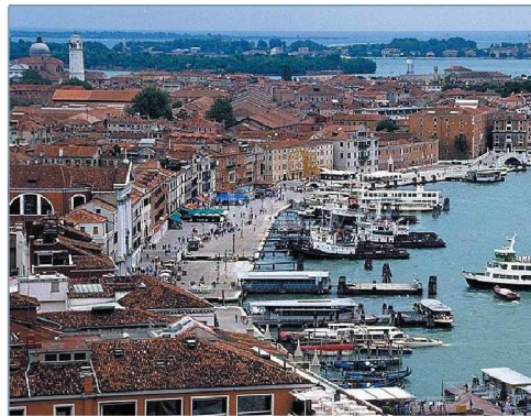
〈그림 4〉 유기적 도시 베네치아

베네치아의 도시성장을 살펴보면 인위적인 도시계획을 통한 도시가 아니라 바다와 운하라는 자연환경과 긴밀하게 연계하면서 성장과 변화를 반복한 도시다. 이에 특이한 공간구조를 가지고 있으며, 비로와 같은 유기적 도시의 특성을 가지고 있다. 계획된 도시가 연출하는 직선적인 조망