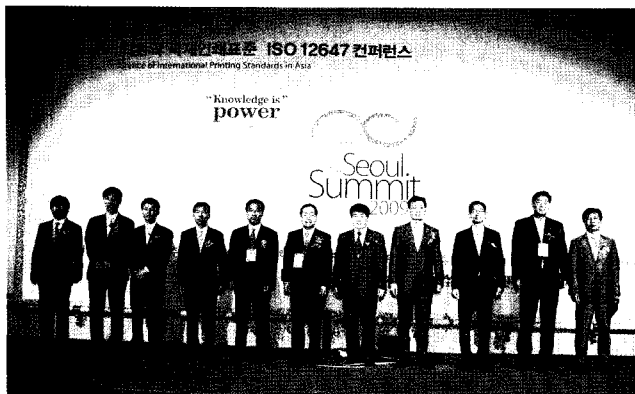
대한인쇄정보기술협회장상을 받은 수상자들