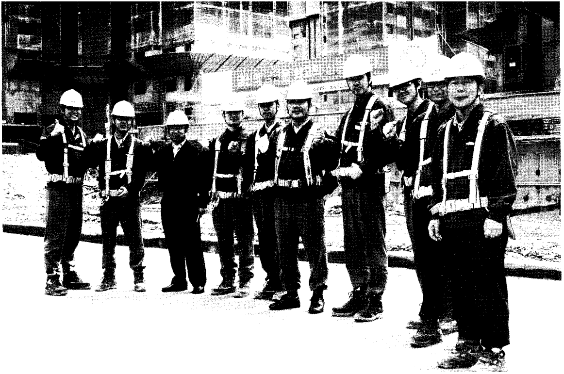
· 삼성래미안(군포산본주공아파트 재건축) 아파트를 군포시의 랜드마크로 만들고자 오늘도 최선을 다하고 있는 삼성인들.

사항 이외에도 모기업과 협력사가 함께하는 상생안전, 모든 계층이 Risk를 집중 관리하는 시스템 안전, 근로자의 마음을 배려하는 감성안전, 근로자의 감각을 고려하는 디자인 안전, 근로자의 건강과 작업장의 작업환경을 개선하는 보건안전까지 폭넓은 안전개념으로 안전관리수준을 향상시키고자 노력하고 있다.