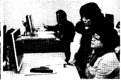
• 시민정보화 교육

▶ 이미 언급했던 바와 같이 경제위기 등의 이유로 빈부 격차는 날로 심화되어가고 있는 경향입니다. 군포시는 경제위기 극복과 더불어 소외계층 지원사업과 일자리 나누기 등의 사업에 앞장서고 있는 것으로 알려져 있습니다. 그 대표적 사례가 궁금한데요.