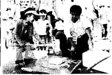
• 어린이날 기념행사