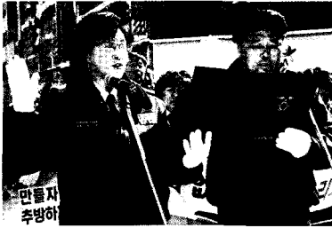
• 안전도시 만들기 선포식