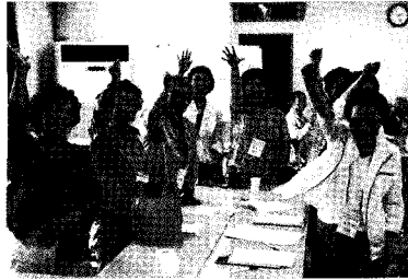
• 어르신 자원봉사학교