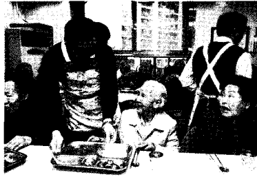
• 무한돌봄위원들의 매화복지관 봉사활동