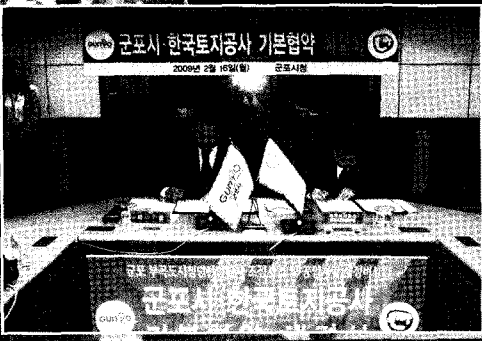
부곡 첨단산업단지 조성협약 체결식