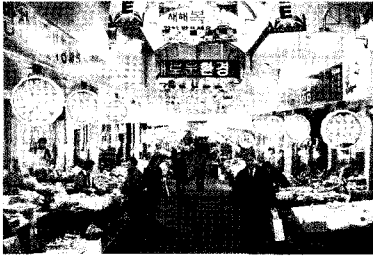
• 잘 정비된 군포 역전 시장