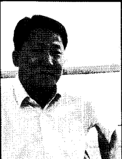
현대중공업(주) 총본부 호호 부장

지역 내 7개의 중·고교 및 대학 운영과, 사원 자녀에 대한 장학금 지급, 최첨단 대학 병원 운영 등 지역주민과 사원 가족을 위한 다양한 활동을 펼치고 있다. 또한 노사공동의 장기기증운동에 6,200명의 사원이 참가하는 등 이웃을 위한 생명나눔운동의 실천을 통해 노사화합의 기반을 다지고 있다.