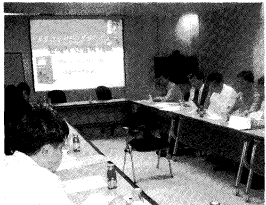
▲ 안심자판기 관련 의견수렴을 위해 개최된 간담회 광경

서울시 식품안전과 홍귀순 팀장은 "일부 자판기 운영자들이 서울시가 왜 안심자판기 추진해 일을 번거롭게 만드느냐 하는 의견도 있는데 이는 오산이다"며 "오히