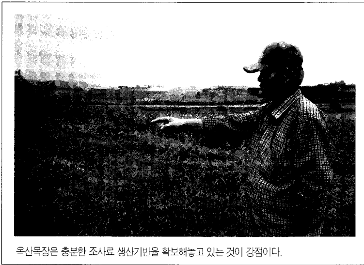
옥산목장은 충분한 조사로 생산기반을 확보해놓고 있는 것이 강점이다.

2006년 탄탄한 인프라 구축과 자연순환형 낙농에 높은 점수를 받으며 최우수상인 농림부장관상을 받은 전북 고창의 옥산목장. 3년이 지난 지금, 달라진 것이 있을까. 최우수 목장의 위용을 당당히, 자신만만하게 지키고 있을 뿐 달라진 것은 없다.