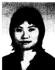
조 해 인 기자

필자는 이번 말복을 기해 색다른 보양식을 찾아 인터넷을 뒤지고 또 뒤졌다. 토종닭 백숙과 삼계탕을 초복, 중복에 이미 먹었던 터라 좀 더 색다른 음식이 먹고 싶었다. 게다가 더위에 지칠대로 지친 체력과 입맛을 한번에 확 돌아오게 할 보양식이 무엇이 있을까 싶었는데, 그러던 중 지인의 소개로 '인삼닭고기냉채'를 소개