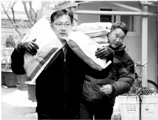
20kg짜리 쌀 두포를 어깨에 멘 승관원 직원들이 서울 중로구 동의동에 위치한 일명 '쪽방촌'으로 향하고 있다.

- 아름다운 가게와 공동으로 독거노인 등 16곳 방문해 쌀과 생필품 전달