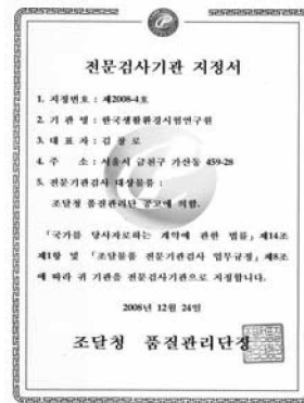
사진1. 전문검사기관 지정서

이번 지정으로, 조달물품에 대한 전문적인 검사 및 시험을 통한 조달물품의 품질향상과 수요기관 및 조달업체의 권익보호에 크게 기여할 것으로 기대된다.