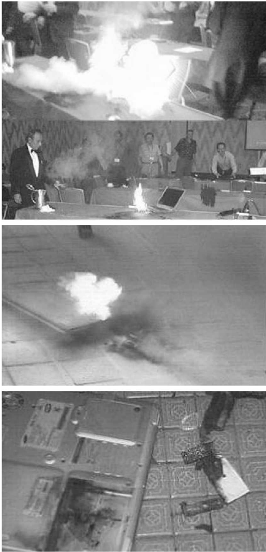
〈그림 3〉 리튬이온 2차전지 사고사례

리튬이온 2차전지의 안전사고 사례를 보면, 해외에서는 2006년 8월 소니가 공급한 리튬이온전지를 탑재한 델 노트북컴퓨터가 폭발하여 대규모 전지 리콜을 불러온 사례가 있고 국내에서도 2008년 초 LG 노트북컴퓨터의 전지가 폭발하여 노트북컴퓨터를 리콜한 사례가 있다. 또한 삼성 전자 노트북컴퓨터의 경우에는 배개 위에 올려 놓고 사용하는 도중 전지가 녹아내리면서 화재가 난 사례도 있다.