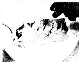
❷ 칼집 넣은 오리가슴살에 소금, 후추를 뿌린다.