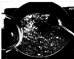
❸ 꿀을 졸이다가 식초와 향신료를 넣어 섞는다.