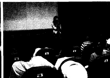
방문객을 대상으로 한 재활용관련 강의