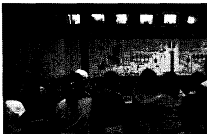
초등학교를 대상으로 한 현장체험교육

환경보전시책 홍보의 목표는 단기적으로는 환경오염 실상, 각종 환경시책 등 환경정보의 공개로 환경행정에 대한 구민의 신뢰도를 제고하여 환경보전 의식을 함양하는데 있으며, 장기적으로는 새로운 세대에 대한 환경홍보의 효율적 추진으로 국가의 환경역량을 배양하고 구민의 환경윤리관을 확립하는데 있다.