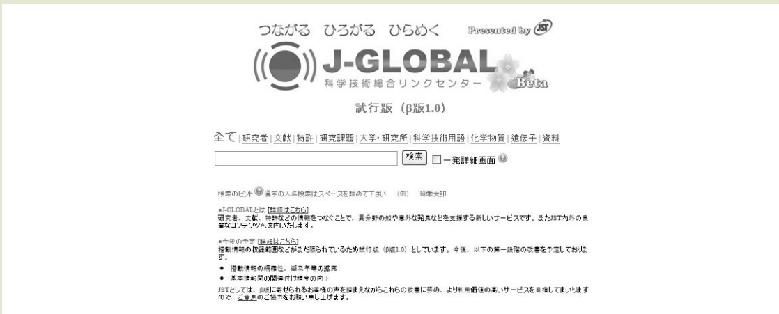
〈그림 1〉 J-Global 검색화면