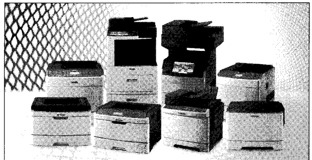
▶신도리코가 선보인 4종의 A4 신제품