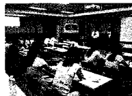
〈지금은 교육 중〉

국제협력사업(KOICA)과 관련하여 필리핀과 베트남으로 1년 동안 파견 예정인 한경대학교 학생 20여명이 축산물 식육 관련 사전 교육을 위해 지난 6월 24일 등급판정소 본부를 방문하였다.