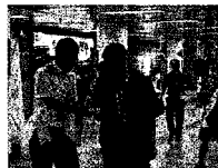
〈시청역 내 홍보〉

쇠고기 이력추적제 유통단계 시행에 따른 등 제도의 조기정착과 시민들이 쇠고기를 구입할 때 이력추적에 대한 이해를 돕고자 서울특별시, 한우협회, 축산기업중앙회 서울특별시지회 관련 기관과 합동으로 지난 6월 16일에 서울 시청역 주변과 마장동 축산물시장에서, 17일에는 독산동에서 가두캠페인을 실시하였다.