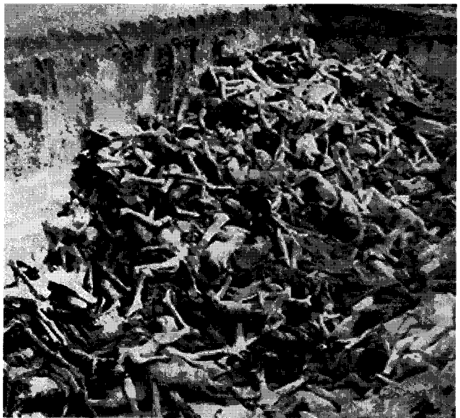
독일 역사학자인 놀테(Ernst Nolte)가 1986년에 소비에트 연방의 수용소 군도(Gulag Archipelago)를 홀로코스트에 비유한 논문이 발표되면서 나치즘과 홀로코스트에 대한 논쟁이 지식인들을 중심으로 화산처럼 폭발되었다.

문제는 이를 균형 있게 조화하며 종합적인 안전 관리를 함으로써 원자력의 안전문화를 정착시키는 일이다. ☸