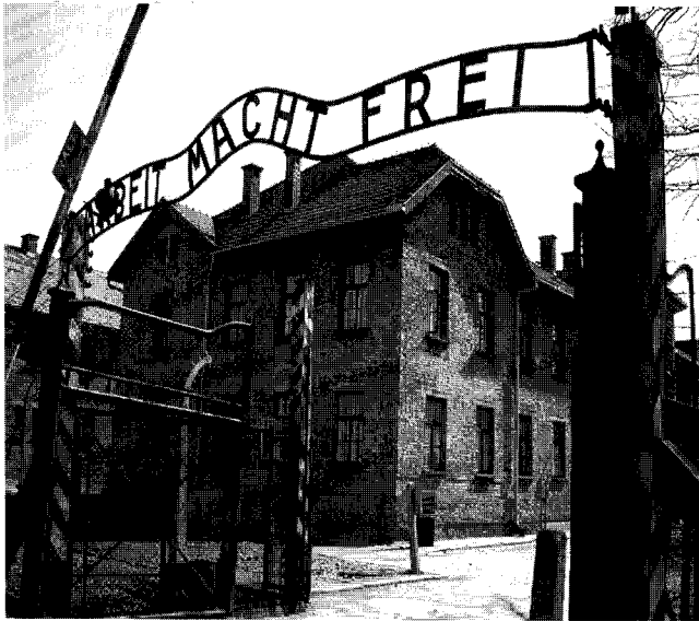
아우슈비츠(Auschwitz) 수용소 (폴란드 소재)

인도적 전쟁 범죄의 책임을 히틀러와 그 당에게 전가함으로써 독일인들을 죄의식에서 구해주는 효과가 있었다.