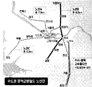
〈그림1〉 경기도의 GTX 3개 노선 제안도

경기도가 추진하는 총 145.5km 구간의 수도권 광역급행철도 노선안에는 킨텍스와 동탄을 연결하는 74.8km 길이의 A노선, 인천 송도와 청량리를 연결하는 49.9km의 B노선, 의정부와 금정을 연결하는 49.3km의 C노선 등 총 3개 노선이 제시되었다.