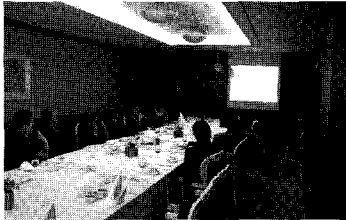
한국수의정책포럼 제21차 정기포럼

한국수의정책포럼(상임대표 : 이문한, 공동대표 : 곽형근, 박용호, 이주호, 장기윤, 정영채, 최상호)에서는 지난 4월 3일(금) 오전 7시부터 서울대학교 호암교수회관에서 회원 및 관계자 등이 참석한 가운데 제21차 정기포럼을 개최하였다.