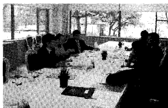
2009년도 제1차 학술홍보국제협력위원회

우리회에서는 지난 3월 12일(목) 오전 11시부터 서울대학교 호암교수회관에서 2009년도 제1차 학술홍보국제협력위원회(위원장 : 박용호)를 개최하였다. 이날회의에서는 대한수의사회지목차 편집계획 및 개편방향, 대한수의사회 요람제작, 대외홍보 개선방안 등에 대하여 협의하였다. 특히, 대한수의사회지의 경우 학술부분 이외에 기획기사 및 수의계현안 분석 등 시사부분을 대폭 강화하여 개편하는 방안을 추진하기로 하였다.