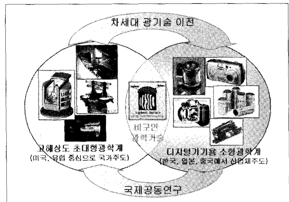
그림 1. 초정밀 광기술 연구현황

그러나 초정밀 광학계는 우주 및 국방산업의 핵심기술로서 미국 등 선진국에서 전략물자로 분류하여 기술이전을 엄격히 제한하고 있다. 현재 한국과 일본이 디지털 기기용 광학부품과 광