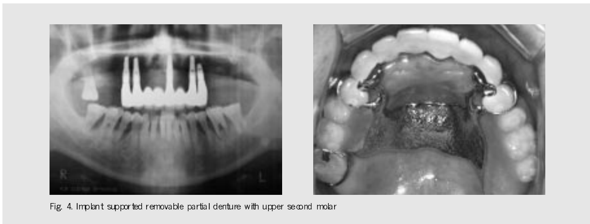
Fig. 4. Implant supported removable partial denture with upper second molar