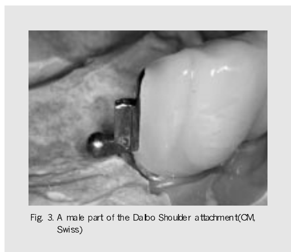
Fig. 3. A male part of the Dalbo Shoulder attachment(CM, Swiss)