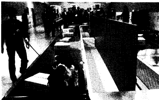
검역탐지견센터 우편수하물 탐색 시연

국장으로 이동해 해외여행객들을 대상으로 전단지과 홍보물을 나누어 주며 청정대한민국을 위해 구제역이나 조류인플루엔자 발생국의 농장이나 축산관련시설 방문을 자제하고, 귀국길에는 해당 국가의 축산물 등을 반입하지 말아줄 것을 홍보했다.