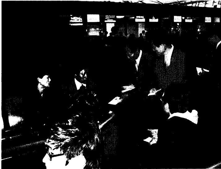
출국 여행객 대상 홍보캠페인

검역원 인천지원으로 이동해 공항에서의 국경검역 업무에 대해 설명을 들었다. 인천지원에서는 인천항과 인천국제공항의 검역 업무를 담당하면서 수입 동물 및 축산물 검역·검사 업무, 검역탐지견 운영, 불법 동·축산물 밀반입자에 대한 수사, 발판소독조 운영 및 국경검역 홍보, 화물터미널을 통한 동·축산물 검역검사, 국제우편물센터를 통한 국제우편물 검사검역 등의 업무를 시행하고 있다.