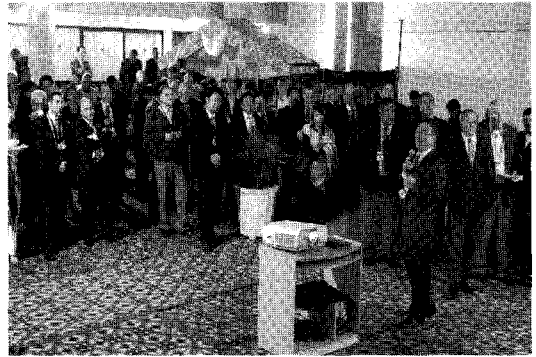
ICID 본부 칵테일파티에서의 유치연설

12월8일 ICID 본부 사무실을 방문하고 싶다는 회원들의 요청에 따라 마련된 칵테일파티에서