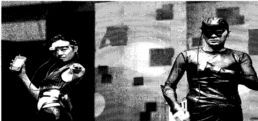
〈그림 2〉 웨어러블컴퓨터의 예