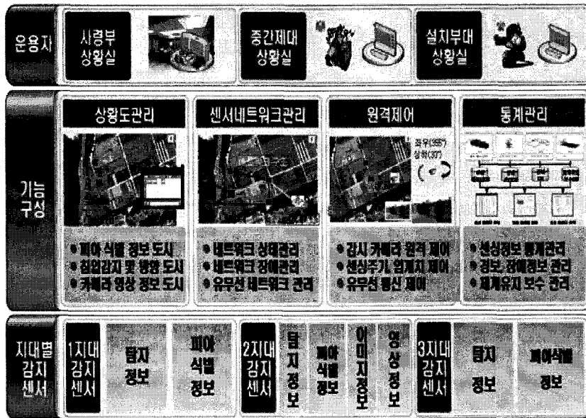
〈그림 5〉 센서 네트워크 기능/성능