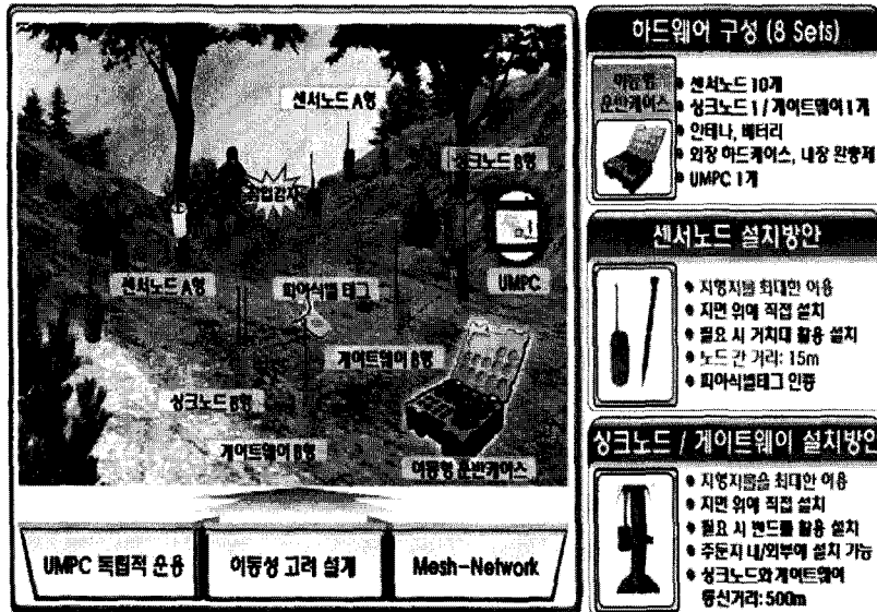
<그림 4> 이동형 하드웨어 구성/설치 방안

용하고 이동형 전장단말기(UMPC)로 운용과 통제가 가능하도록 구성한다.