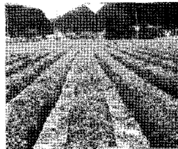
▲ 생육 중기포장