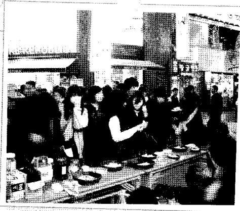
시식행사에 몰려드는 사람들