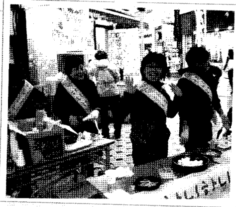
곳은날씨에도 홍보에 열중하시는 여성회원들