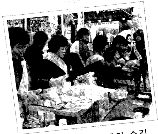
분주한 여성회원들의 손길