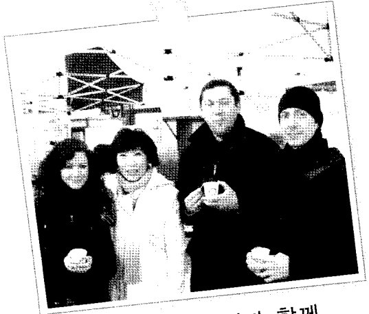
외국인 관광객과 함께