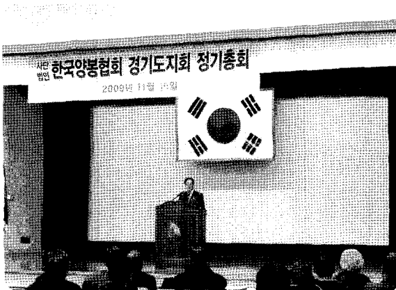
경기지회 총회 / 윤화현 지회장님 인사말

한편, 협회는 오는 1월 7~8일 협회 감사, 12~13일 협회 이사회를 개최하고 29일(금)에는 대전 아드리아 호텔에서 제 37차 정기총회를 개최할 계획이다. 양봉