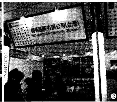
① 맥걸리엑스포 ② 해외관 전경 ③ (주)코리아더카드 시식 및 전시 모습

로 반영한 듯 하반기 최대 규모로 개막하였다. 이번 행사는 <국제식품박람회>, <국제조리기계 및 단체급식 우수 기자재전>, <서울쌀박람회 및 발효식품전>, <프리미엄 농수축산물전>, <국제호텔 & 레스토랑 산업전>, <2009 식품포장전시회>, <2009 맥걸리엑스포> 등 7개 전시회를 통합 개최되면서, 식품 산업 종사자 뿐만 아니라 일반인들에게도 다양한 볼거리를 제공하였다. 특히 농림수산식품부가 후원한 맥걸리엑스포에서는 국내 맥걸리 선두 업체와 각 지역별 특색 있는 제품들