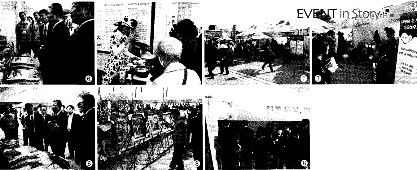
⑥ 농협중앙회 최원병 회장과 각 단체인장들이 쌀 농가와 이야기를 나누고 있다. ⑦ 낙농육우협회 행사 모습 ⑧ 다양한 전시 및 시식행사 모습

동본부에서 마련하고, 궁극적으로는 「총체적 비용절감 운동」으로 발전되어야 할 것이다.