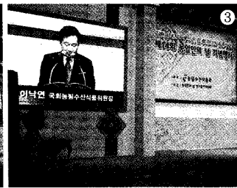
① 식전공연 '아리랑 파티' ② 행사장 전경 ③ 주요인사의 모습

사 역시 농민들의 축제답게 민명나는 '아리랑 파티'의 식전공연으로 성대한 막을 열었다.