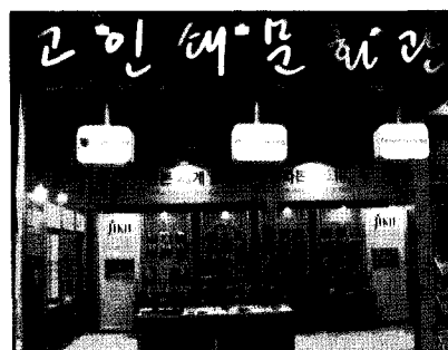
대한민국 지방자치경영대전(COEX 인도양홀)