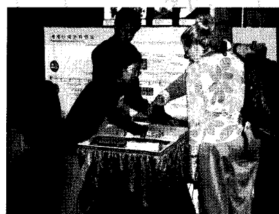
Book Expo America 2009(미국 뉴욕)