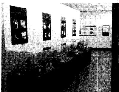
직지 및 고인쇄 특별전시(제주대학교 박물관)