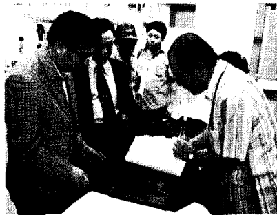
제5회 국제특수인쇄산업전(코엑스 대서양관)