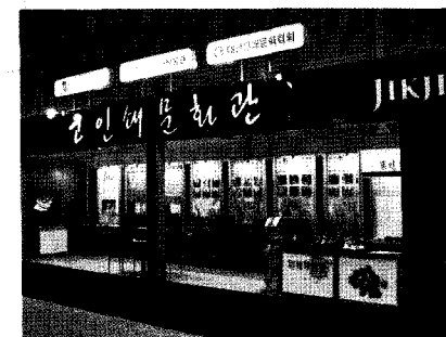
제46회 전국 도서관 대회(창원 컨벤션센터)