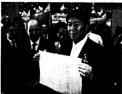
2009 서울국제도서전(코엑스 태평양관)