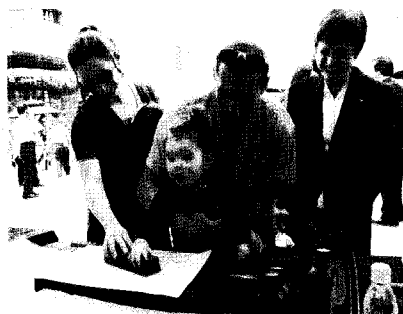
서울인쇄축제(서울시청 앞 서울광장)