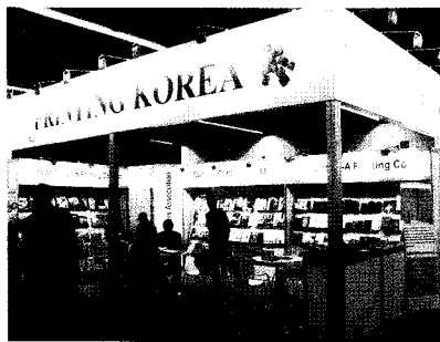
프랑크푸르트도서전에서 한국관 모습