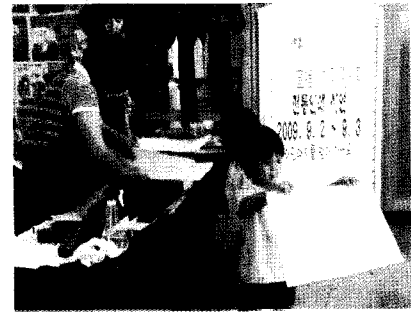
직지 및 교인쇄 특별전시(의정부 과학도서관 1층 로비)