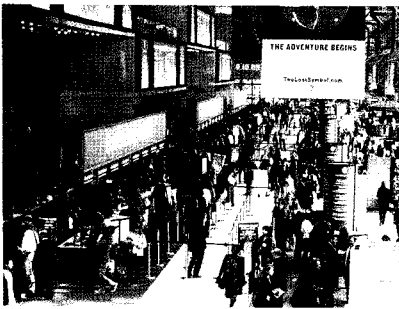
Book Expo America 2009 모습