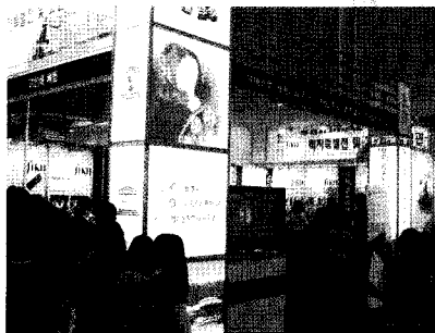
대한민국축제박람회(인천 송도 컨벤시아)