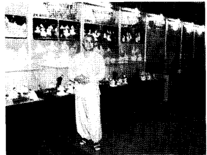
직지 및 교인쇄 특별전시(합천 해인사)