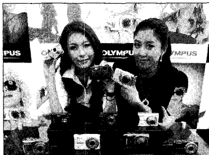
▶모델들이 올림푸스 콤팩트카메라 신제품 라인업을 선보이고 있다.