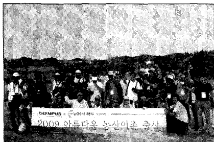
▶올림푸스의 농산어촌 출시단원의 모습

올림푸스한국(대표·방일석)은 10월과 11월 두 차례에 걸쳐 우리나라의 농산어촌을 DSLR 카메라에 담아내는 '2009 아름다운 농산어촌 출시' 대회를 실시한