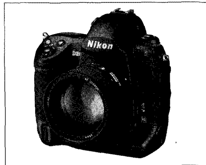
▶니콘의 FX포맷 플래그십 DSLR D3S

니콘이미징코리아(대표·야마구치 노리아키)가 FX포맷 플래그십 DSLR 카메라인 'D3S'를 최근 전세계 동시 발표했다. 'D3S'는 지난 2006년 출시한 'D3'의 후속 모델로 전문 촬영을 요하는 프로 사진 작가들을 위한 고성능 DSLR 카메라다. 기능면에서는 D3의 고감도 성능을 한 차원 업그레이드한 모델로 특히 ISO를 200부터 12800까지 지원하고 있어 확장 시에는 저감도 ISO 100과 고감도 ISO 102400 상당(Hi3)까지 증감 가능하다. 또 최근 캠코더 영상촬영에 대한 사용자 요구가 증대됨에 따라 동영상 촬영 기능인 디무비(D Movie)기능이 탑재돼 있어 영상 촬영중 원하는 구간만을 선택하고 저장할 수 있게 됐다.