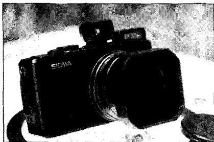
▶시그마의 신제품 디카 DP1s

세기P&C(대표·이봉훈)는 1400만 화소의 포베온 X3 다이렉트 이미지 센서(2652×1768×3 layers)를 내장한 새로운 시그마 DP1s 콤팩트 디지털카메라 'DP1s'를 출시한다고 밝혔다. 'DP1s'는 작년 3월에 소개된 DP1의 업그레이드 버전으로, DP2와 SD14에 적용된 QS(Quick Set) 기능을 줌 버튼으로 사용할 수 있도록 제작됐다. 이 기능을 통해 카메라를 좀 더 빠르고 편리하게 다룰 수 있으며 놀라운 해상력과 자연스런 색감, 3차원 느낌의 풍부한 계조를 경험할 수 있다는 것이 회사 관계자의 설명이다. 또한, 역광 촬영 시 우수한 성능을 보여준다. 뷰파인더 VF-11와 후드 어댑터 HA-11 그리고 플래시 EF-140DG 등 전용 액세서리도 구성돼 있다.