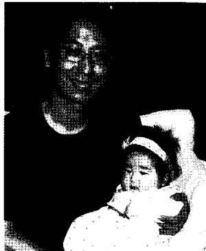
보이지 않는 곳에서도 소명의식을 갖고 열심히 땀 흘리는 이들이 있기에, 안전 포스코센터가 가능하리라 생각한다.