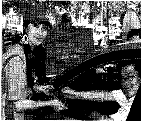
한국의 주유소 풍경

나름대로 계산을 하여 적당하다고 생각되는 금액을 넣은 후에 기름을 넣어도 기름 탱크에 기름이 다 차지 않은 경우도 있고, 다른 나라에 갔을 때에는 환율 계산도 복잡해 절만도 차지 않아 기름을 서너 번씩 넣은 경우도 있다. 이리다 보니 기름 넣을 때를 대비하여 작은 액수의 지폐를 미리 준비하기도 하고 사람이 있는 주유소를 미리 알아놓기도 한다.