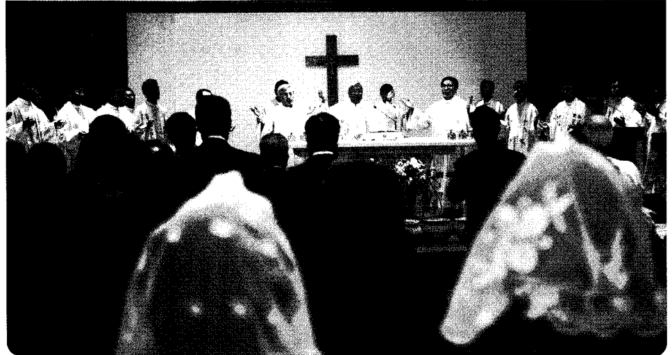
↑ 세계병자의 날 기념식에 참가한 함우 및 교직원