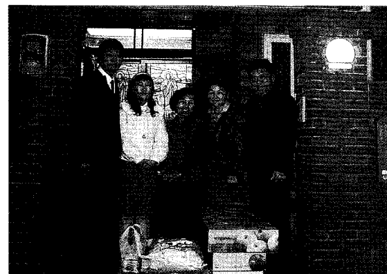
▲ 믿음의 집 방문, 인천지부 (1월 22일, 믿음의 집(인천 중구 송월동 소재))