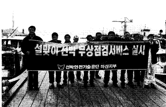
▲ 어선기관 무상점검서비스, 마산지부 (1월 22일, 마산시 진동면 광암항)