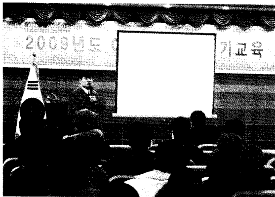
▲ 2009년도 어업인 안전조업 정기교육, 제주지부 (1월 29~30일, 성산포수협관내 어업인복지회관 등)