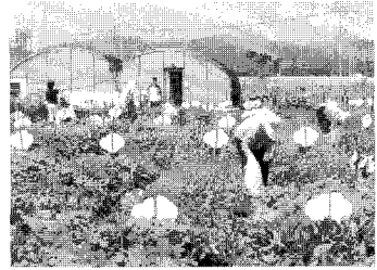
초록텃밭에서 채소를 가꾸는 모습