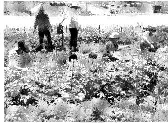
초록텃밭에서 채소를 가꾸는 모습