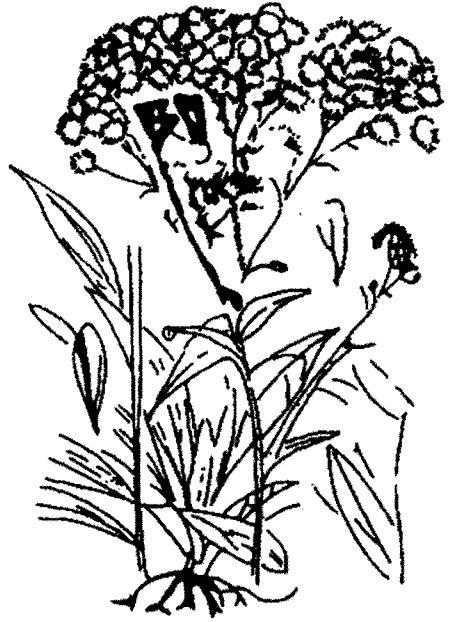
도감에 나와있는 옹긋나물의 그림