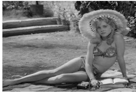
<그림 3>비키니를 착용한 팜파탈, Warner Entertainment Co., 1962 워너브러더스 코리아(주)

그러나 <그림 3>에서 보여지는 로리타가 착용한 비키니는 가슴의 골이 보이고 허벅지의 임파선을 따라 팬티의 선이 지나가는 스타일로 당시로서는 파격적인 노출을 보여주고 있다. 이 장면은 교수인 험버트를 만나게 되는 첫 대면의 모습으로 험버트가 첫눈에 반하게 되는 로리타의 모습이다. 로리타는 14세의 어린나이와는 달리 육감적 몸매를 그대로 드러냄으로서 관능적인 매력을 당당하게 표현하고 있으며 뇌쇄적 눈빛으로 남성을 지배하는 카리스마를 동시에 연출하는 팜 파탈을 표현하고 있다.