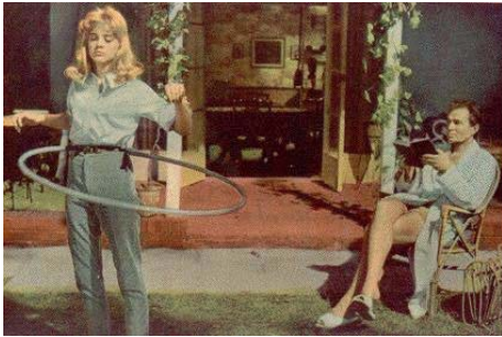
<그림 2>틴에이지 스타일, <로리타>포스터 Warner Entertainment Co., 1962

<그림 2>는 여가생활 중인 험버트 앞에서 로리타가 훌라후프를 하는 장면으로 험버트를 유혹하지만 걸으로 드러난 모습은 애써 험버트를 외면함으로써 전형적인 팜 파탈의 모습을 연출하고 있다. 훌라후프의 율동을 통한 유혹적 몸짓과 나르시즘적 제스처어 오는 달리 컬러로 촬영된 포스터에서 볼 수 있듯이 화장기 없는 모습과 틴에이지 스타일의 순수하면서 꾸미지 않은 내추럴함으로 자신의 어머니이자 연적인 살롱을 물리치고 험버트를 차지하고자 하는 의도된 간교함을 연출하고 있다.