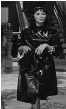
<그림 6>모던클래식의 신여성스타일, Warner Entertainment Co., 1962, 워너브러더스코리아(주)

퀼티의 애인이 입고 있는 스타일에서 1961년 소련이 최초로 유인 우주선을 쏘아올린 후 우주와 인류의 미래에 대한 관심의 표현으로 소재에 있어서는 빛의 효과를 노린 글리터리한 느낌의 소재나 투명한 소재의 사용과 디테일을 사용한 장식을 배제한 단순한 스타일이 1960년 중반의 코스모폴 룩(Cosmo-corps Look)에 연결되어 있음을 알 수 있다. 한편으로는 헤어스타일에서 메이크업, 복식스타일에게까지 중세적 느낌의 블랙무드로 뱀파이어적인 사악한 여성의 모드를 연출하여 무언의 동의 속에 퀼티의 교활한 음모를 우회적으로 표현하고 있다. 또한, 장년층을 대상으로 1950년대 유행했던 장갑이 1960년대 초반에도 잔존되어 1960년대의 단순성과 1950년대의 장식성이 혼합되어 나타나고 있음을 알 수 있다.