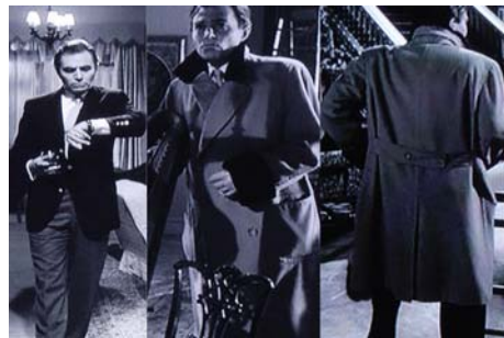
<그림 7 左, 中, 右>유럽풍남성복스타일-험버트, Warner Entertainment Co., 1962, 워너브러더스 코리아(주)

로리타에게 실연당하고 로리타를 유린하고 농락한 퀼티를 복수하기 위해 퀼티를 찾은 험버트의 모습은 복수의 목적을 달성하기 위한 도전적이고 결연한 모습을 전투적이며 활동성이 가미된 밀리터리 스타일로 연출하고 있다.<그림 7 中, 右>