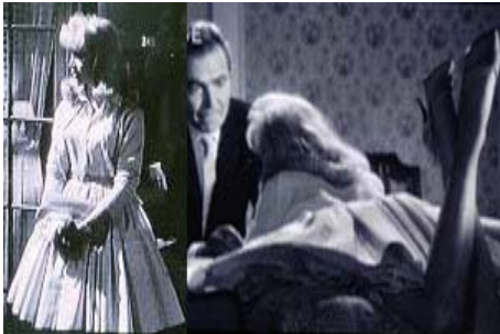
<그림4>관능적 팜 파탈 스타일, Warner Entertainment Co., 1962 워너브러더스 코리아(주)

<그림 4>는 로리타와 험버트의 도피 행각 중 호텔에 처음 함께 묵게 되는 장면으로 성적 환상에 대한 잠재된 욕망의 분출이자 꿈꾸어왔던 일상의 탈출에 대한 내재된 심리상태를 관능적 팜 파탈 스타일로 연출하고 있다.