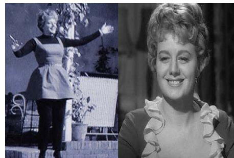
<그림 5 左,右>유럽적 시크함, Warner Entertainment Co., 1962, 워너브러더스 코리아(주)

욱 가속화시켰으며 또한 브리짓 바르도의 검은 레오타드 록이 성인여성에게도 어필되어 평상복으로 착용되었다. <그림 5左>에서 보는 바와 같이 살롯이 사브리나 팬츠나 레오타드록을 착용한 것을 볼 때 미국에서도 유럽의 시크한 스타일이 유행하였음을 알 수 있다. 그러나 살롯은 1950년대의 보수성으로 인해 레오타드 록에 점퍼 스커트를 착용함으로써 몸에 붙는 피트함을 가리는 절충적 스타일을 연출하고 있으며 당시 유행이었던 사브리나 팬츠의 착용으로 험버트에게 적극적으로 구애하는 살롯의 능동적 캐릭터를 더욱 잘 부각시키고 있다. 그러나 영화 속 살롯의 경우 브리짓 바르도가 유행시킨 낮은 굽의 발레리나 슈즈를 신기 보다는 펌프스 힐을 착용함으로써 신체적 결함을 커버하고 있으며, 여성의 신체적 특징을 잘 부각시킬 수 있는 니트와 파인 네크라인에 물결치는 듯한 러플이 달린 블라우스의 착용은 <그림 5右> 험버트에게 버림받고 자살에 이르게 되는 연약하며 유약한 여성적 캐릭터를 부각시키고 있다.