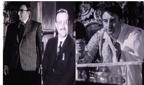
<그림8左,中,右>유럽풍의 남성복 스타일-켈티, Warner Entertainment Co., 1962 워너 브러더스 코리아(주)

는다. 험버트에 의해 살해당하기 전 켈티의 모습은 그 전에 보여졌던 절제되고 지적인 모습과는 달리 알콜중독자의 반쯤 정신 나간 모습으로 험버트에게 케번을 늘어놓는 망가진 모습을 잠옷과 슬리핑 가운을 걸치고 짐을 정리하기 위해 덮어 놓은 시트를 두른 모습으로 연출되어 마지막 순간의 피폐된 모습을 냉소적으로 그려내고 있다.<그림 8 右>